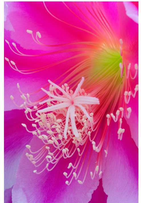
Cactus orquídea, photo gracieuseté de Don Paulson

La réunion annuelle des membres du Conseil d'Administration et de l'équipe de l'école UBIS s'est tenue du vendredi 7 au dimanche 9 novembre 2014 dans les bureaux de la Fondation Urantia à Chicago. 9 personnes siègent au conseil d'administration et 7 autres forment l'équipe de volontaires. Durant la réunion, il a été notamment décidé de créer le site Moodle de l'école UBIS pour la communauté portugaise. Il sera opérationnel pour le trimestre de septembre 2015. D'autres décisions importantes ont été prises, elles seront présentées dans le bulletin d'Avril 2015.